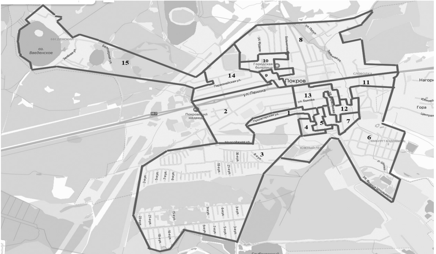
Схема одномандатных избирательных округов для проведения выборов депутатов Совета народных депутатов город Покров Петушинского района Владимирской области