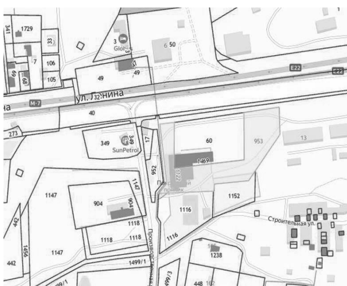
Схема расположения земельного участка с кадастровым номером 33:13:070159:953

Приложение к решению Совета народных депутатов городского округа Покров Владимирской области от 20.11.2025г. № 88/7-25